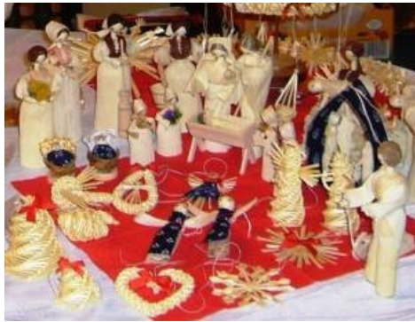
Kladensko a Slánsko je regionem s pestrými vánočními zvyky